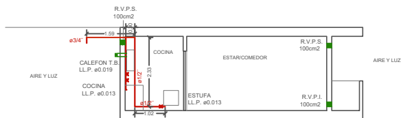
CORTE LONGITUDINAL Esc: 1:100